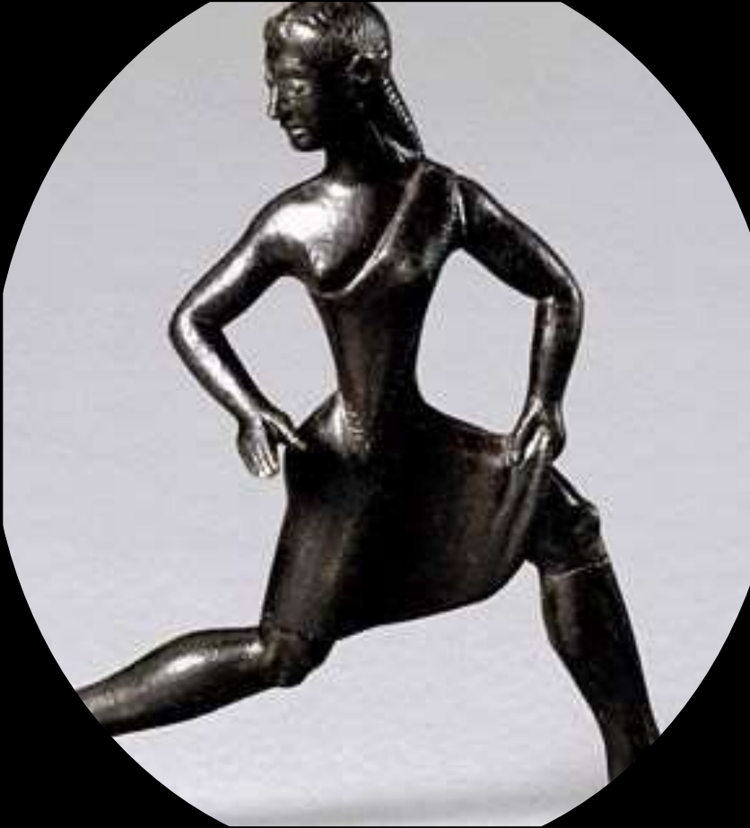
Ragazza spartana che corre